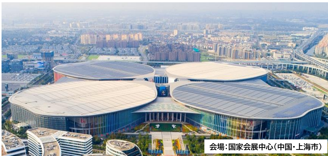
会場：国家会展中心(中国・上海市)

今後更に中小企業・小規模事業者の中国市場進出を促進するため、本事業をご活用頂きたくご案内致します。